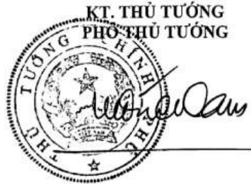
Vũ Đức Đam