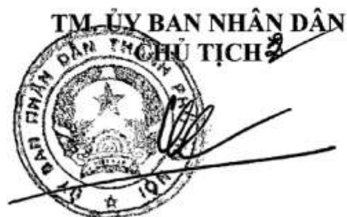
Nguyễn Đức Chung