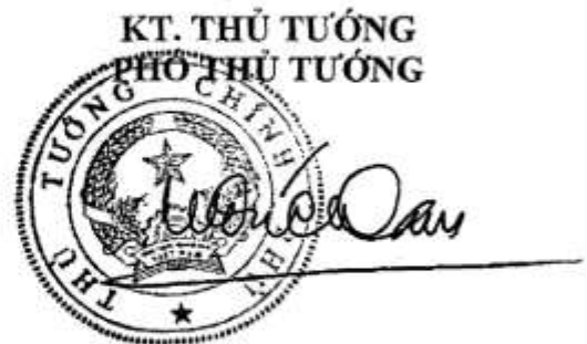
Vũ Đức Đam