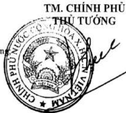
Nguyễn Xuân Phúc