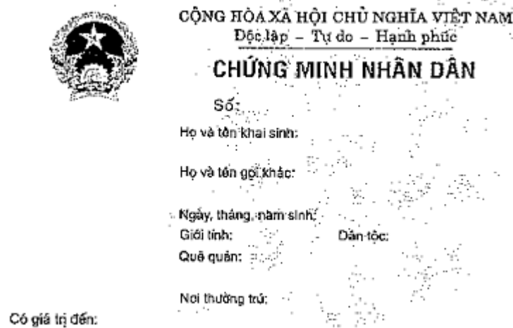
Hình 1 - Mặt trước.

a) Mặt trước: Bên trái, từ trên xuống: Hình Quốc huy nước Cộng hòa xã hội chủ nghĩa Việt Nam, đường kính 14 mm; ảnh của người được cấp Chứng minh nhân dân cỡ 20 x 30 mm; có giá trị đến (ngày, tháng, năm). Bên phải, từ trên xuống: Cộng hòa xã hội chủ nghĩa Việt Nam, Độc lập - Tự do - Hạnh phúc; chữ "Chứng minh nhân dân"; số; họ và tên khai sinh; họ và tên gọi khác; ngày, tháng, năm sinh; giới tính; dân tộc; quê quán; nơi thường trú.