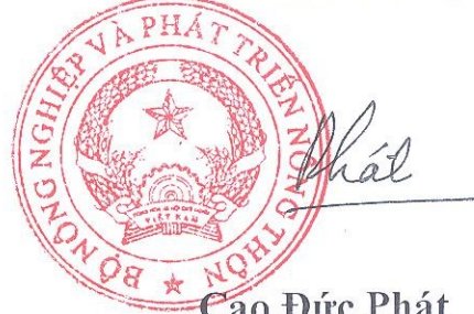
Cao Đức Phát

BỘ TRƯỞNG BỘ NÔNG NGHIỆP VÀ PHÁT TRIỂN NÔNG THÔN