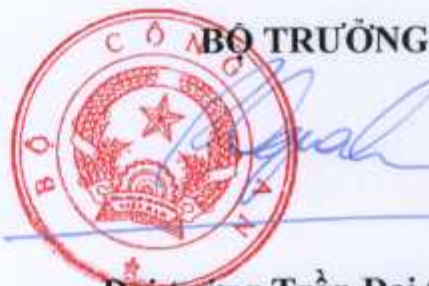
Đại tướng Trần Đại Quang

2. Bồi thường thiệt hại theo quy định của pháp luật nếu gây thiệt hại về tài sản của trường giáo dưỡng hoặc của người khác.